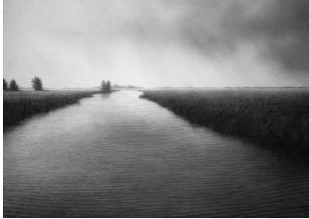
Gerrie Wachtmeester, Fluisterbootje , 2009, olie op paneel, 20 x 28 cm, Foto © Gerrie Wachtmeester.

ook altijd zal zijn. De schilders die het fijnrealisme beoefenen, hebben eigen publieke kanalen. Er is een galeriecircuit dat zich louter richt op kunst die dicht bij de werkelijkheid staat en sinds enige tijd kunnen de beoefenaars zich onder gelijken tonen op een eigen kunstbeurs, Realisme , die in 2010 zijn zevende editie beleefde. Realisme is hier ook te lezen als “ Real is me ”, en de beurs heeft als uitgangspunt figuratie, waarmee alle stijlen zijn vertegenwoordigd. Hier werkt waarschijnlijk de wet van de commercie evenzeer door: zet een aantal gelijkaardige ‘winkels’ bij elkaar en de omzet van alle deelnemers stijgt. Meer keuze (van eenzelfde soort) trekt nu eenmaal meer publiek en overwint het concurrentiebeginsel. (Fijn)realistische schilderijen worden goed verkocht. Nu zal geen van deze kunstenaars prijzen als Damien Hirst halen, maar het trouwe publiek maakt werken in de duurdere segmenten mogelijk. ING is al even genoemd. Sacha Tanja (1942-2004) heeft als conservator van de ING-collectie eenduidig stelling genomen om deze bedrijfsverzameling het prerogatief van figuratieve kunst te geven.