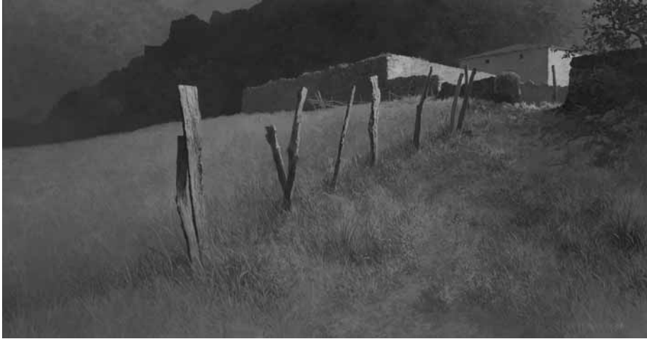
Peter Durieux, Labrot , 2008, acrylverf op paneel, 20 x 39 cm, Foto © Peter Durieux / Art Revisited.

Daaraan voorafgaand organiseerde hij in 1998 de Eerste Onafhankelijke Realisten Tentoonstelling . Sinds 2006 is Museum Møhlmann neergestreken in Appingedam. Vrolijk plagerig gaf hij zijn museum een ‘ondertitel’ mee: “Voor kunst die wat voorstelt”.