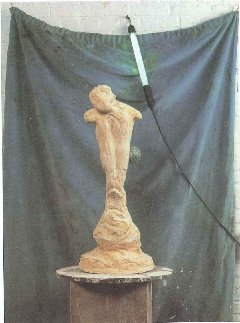
Johan Tahon, „Panasonic”, 1997/98, gips, hout, doek en neon, 258 x 48 x 83 cm. Verzameling Stedelijk Museum voor Actuele Kunst, Gent.