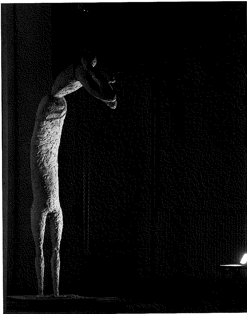
Johan Tahon, „Esso visioen”, 1995, gips en metaal, 406 x 90 x 150 cm. Verzameling Ministerie van de Vlaamse Gemeenschap, Brussel.

dat de vrij compacte beeldjes die hij toen maakte in wezen weinig verschillen met de opener en monumentalere sculpturen die hij de laatste jaren creëert. Eenzelfde zoeken ligt eraan ten grondslag. „Het is de existentiële vraag die in mijn beelden vorm heeft gekregen. Ik gebruik het woord existentieel niet graag, maar ik weet niet hoe ik het anders moet uitdrukken. Mijn sculpturen zijn een spiegelbeeld, als ik erover spreek is het alsof ik over mezelf praat. Het gaat over de twijfels en de angsten die diep in mezelf knagen. Tegelijk hebben de beelden ook iets universeel omdat ze oervragen uitdrukken waar, denk ik, ieder mens mee worstelt.”