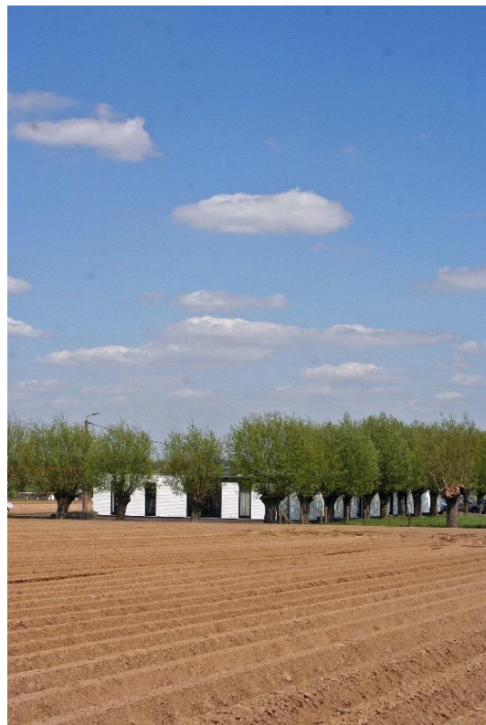
Les bureaux de “Ons Erfdeel vzw” à Rekkem (Menin), tout près de la frontière franco-belge.