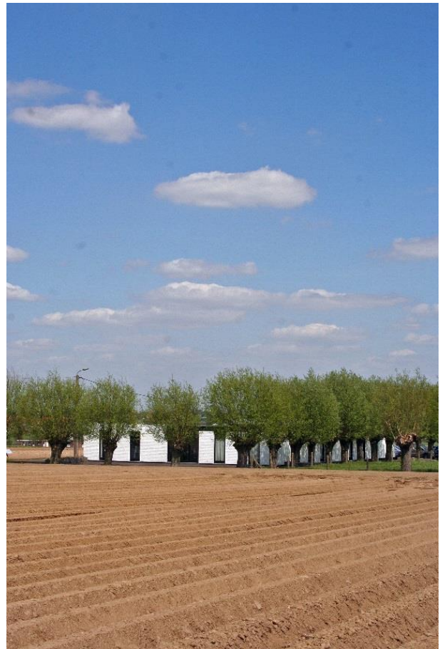
De kantoren van “Ons Erfdeel vzw” in Rekkem (Menen), op de Belgisch-Franse grens.