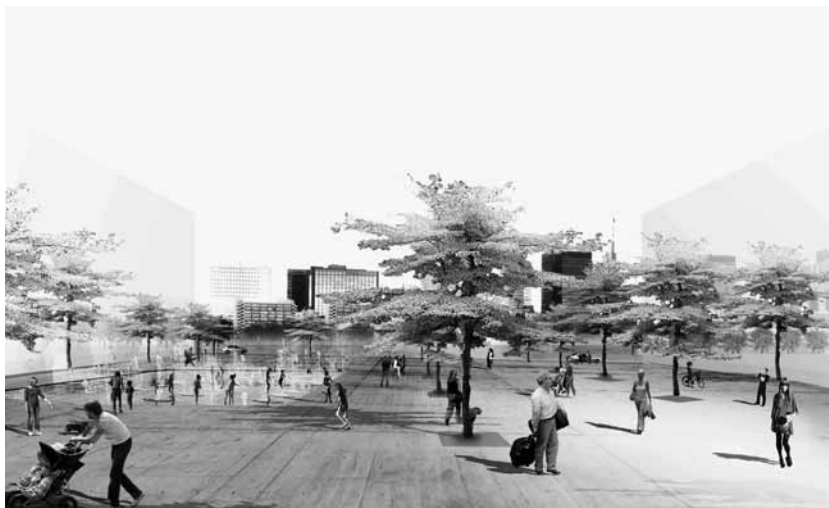
Bureau Bas Smets, espaces extérieurs du site de Tour & Taxis, Bruxelles, perspective depuis le parvis, 33 ha, 2009.

d'Ingelmunster (Flandre-Occidentale), l'espace entourant les nouvelles salles de théâtre de la compagnie des Ballets C de la B et du Muziek Lod sur le site de la Bijloke à Gand, les patios d'un centre de repos et de soins à Lommel, dans le Limbourg belge, l' Arenaplein de Tirlemont, dans le Brabant flamand, l'extension de la zone de services du Kennedypark à Courtrai ainsi que l'aménagement extérieur de Courtrai Xpo et des espaces publics de la nouvelle gare de Roeselare (Flandre-Occidentale), et le schéma directeur du site de Tour & Taxis à Bruxelles. De concert avec le bureau de Joshua Prince-Ramus (REX) à New York, il vient de remporter le concours pour une nouvelle bibliothèque à Courtrai. En Estonie, il réalise un parc public autour du Musée national estonien de Tartu.