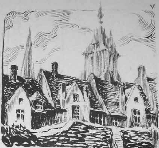
Vieilles maisons d'arrière l'Abbaye

Elle fut le centre artistique de Flandre Maritime. Ses moines fu- rent des Mécènes passionnés de beauté. Les maîtres du Musée de Bergues proviennent de l'Abbaye. Ceux de l'église St Martin ont la même origine. Lorsque l'on étudie les œuvres de nos artisans locaux on retrouve toujours la protection éclairée des Benedictins de l'Abbaye de St Winoc.