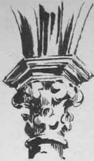
Chapiteau du XIV e encasté dans la muraille de la tour.