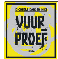
5. Vuurproef. Dichters Dansen niet. Nieuw Amsterdam, 38 blz. € 19,95 (incl. cd)