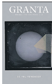
1. Granta. Do You Remember? Granta Publications, 256 blz. € 16,99