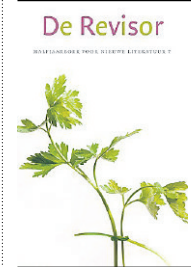
2. De Revisor. Halfjaarboek voor nieuwe literatuur 7. 116 blz. € 19,95