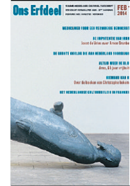
4. Ons Erfdeel 1/2014, Stichting Ons Erfdeel, 200 blz. € 18,-