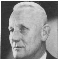
ALBERT ALBERTS werd geboren in 1911 te Haarlem. Studeerde Indologie. Publiceerde romans: „De Bomen” (1953); „De vergaderzaal” (1974); „De honden jagen niet meer” (1979); „De zilveren Kogel” (19 ) en verhalen „De eilanden” (1952); „Haast hebben in september” (1975). Hij publiceerde ook een aantal historische studies. In 1975 ontving hij de C. Huygensprijs.

Dat vertellen was overigens in het Indië van toen een normaal verschijnsel. Met uitzondering van drie of vier grote steden, waar wat meer Nederlanders woonden dan elders in de provincie, waren de bijzonder kleine Europese gemeenschappen aangewezen op de afleiding, die ze elkaar konden bezorgen. Geen bioscoop, geen reizende theatergezelschappen, geen voordrachtskunstenaars, niets, niets, niets. En omdat de mensen niet elke geslagen avond wilden briden, werden er verhalen ver-